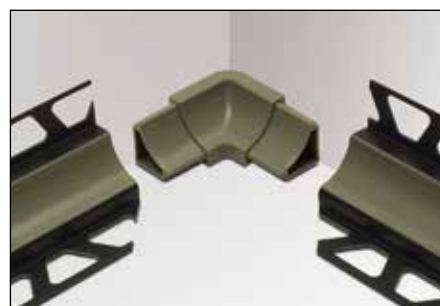
Angle rentrant I2 (2 sorties)