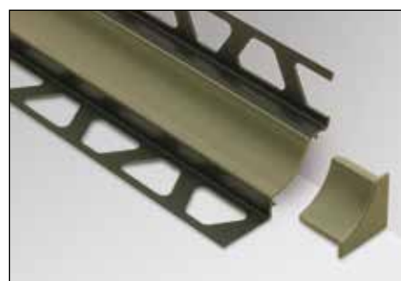
Capuchon de fermeture